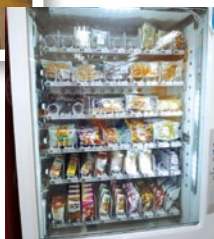
▲コンビニ 自動販売機