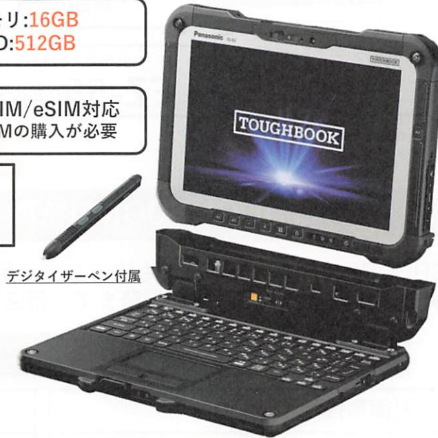
デジタイザーペン付属