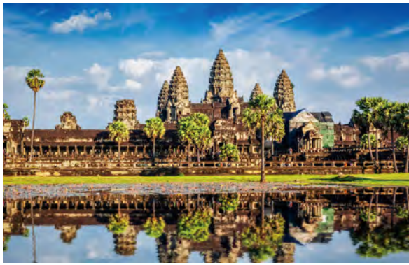
フリータイム時:アンコールワット(イメージ)