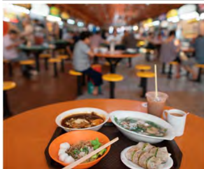
ホーカー (屋台街) とローカルフード