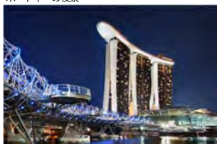
マリーナベイ夜景