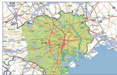
※提供したデータをお客さまにて地図上に可視化したイメージ